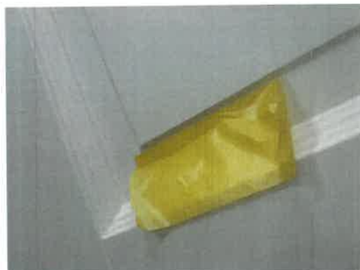
Figur 2: Frihåndsbeskæring (Tape = maling)