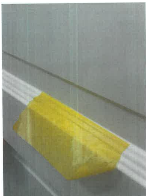
Figur 1: Tapebeskæring (Tape = tape)