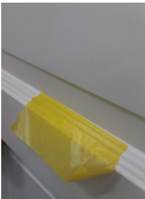
Figur 1: Tapebeskæring (Tape = tape)