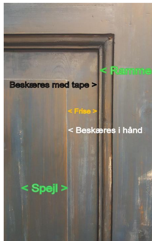
Figur 2: Frihåndsbeskæring (Tape = maling)