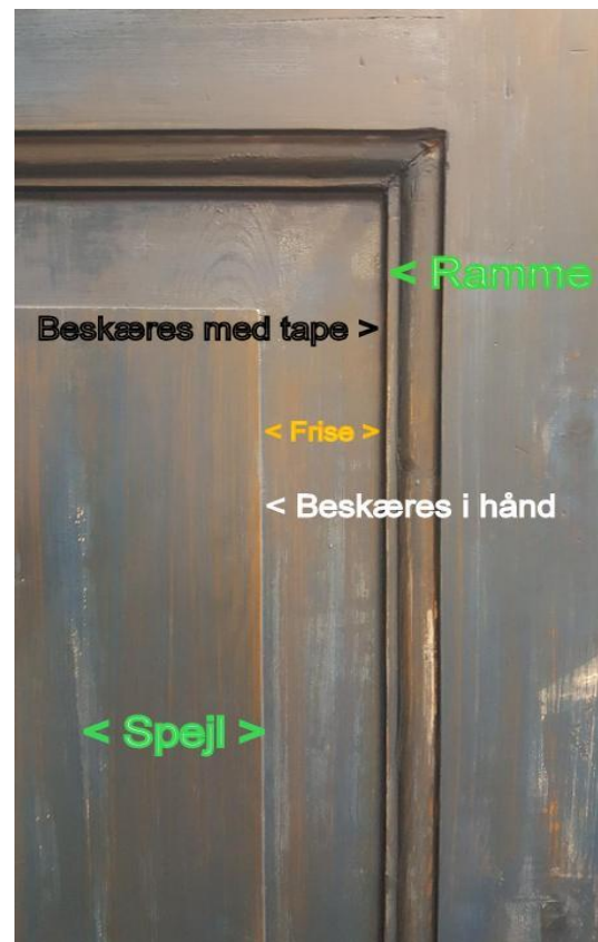
Figur 2: Frihåndsbeskæring (Tape = maling)