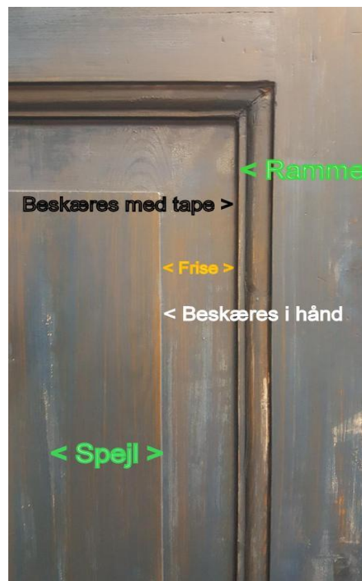
Figur 2: Frihåndsbekæring (Tape = maling)