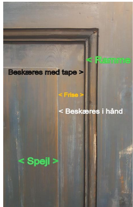
Figur 2: Frihåndsbeskæring (Tape = maling)