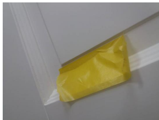
Figur 2: Frihåndsbekæring (Tape = maling)